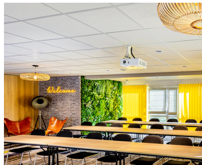
2 salles de réunion